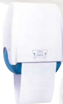
Dispenser manuale per rotolo stoffa