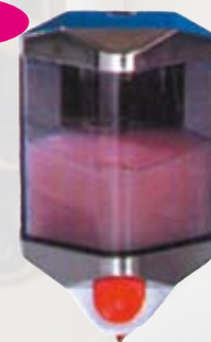
Distributore sapone liquido l 0,55 bianco/trasparente