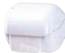
Dispenser porta carta igienica rotolo