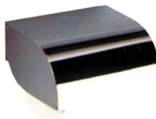
Porta rotolo carta igienica inox