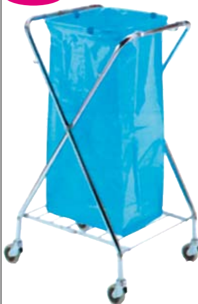
Carrello quadro fisso cromato