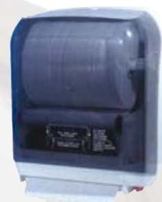
Dispenser manuale per rotolo carta taglio automatico