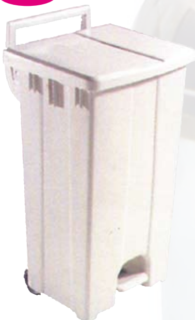
Pattumiera a pedale a norma HACCP da l 90 bianca in materiale plastico