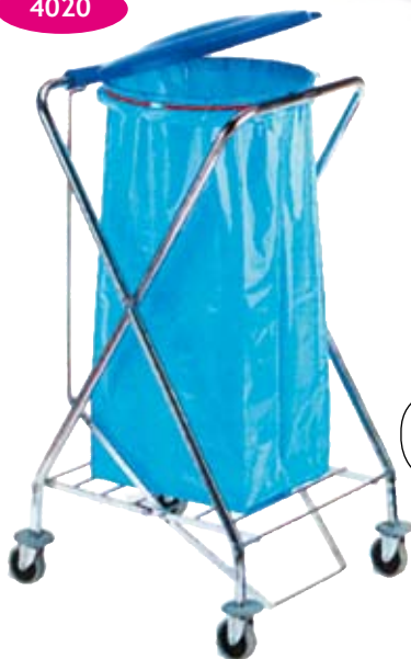
Carrello tondo con coperchio a pedale cromato