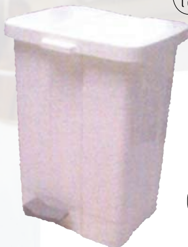
Pattumiera a pedale in plastica l 25