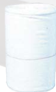
Rotolo in stoffa per dispenser manuale colore bianco