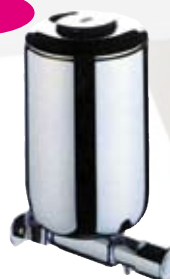
Spandisapone inox 0,5 l