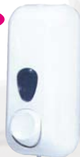
Distributore sapone liquido l 0,55 bianco